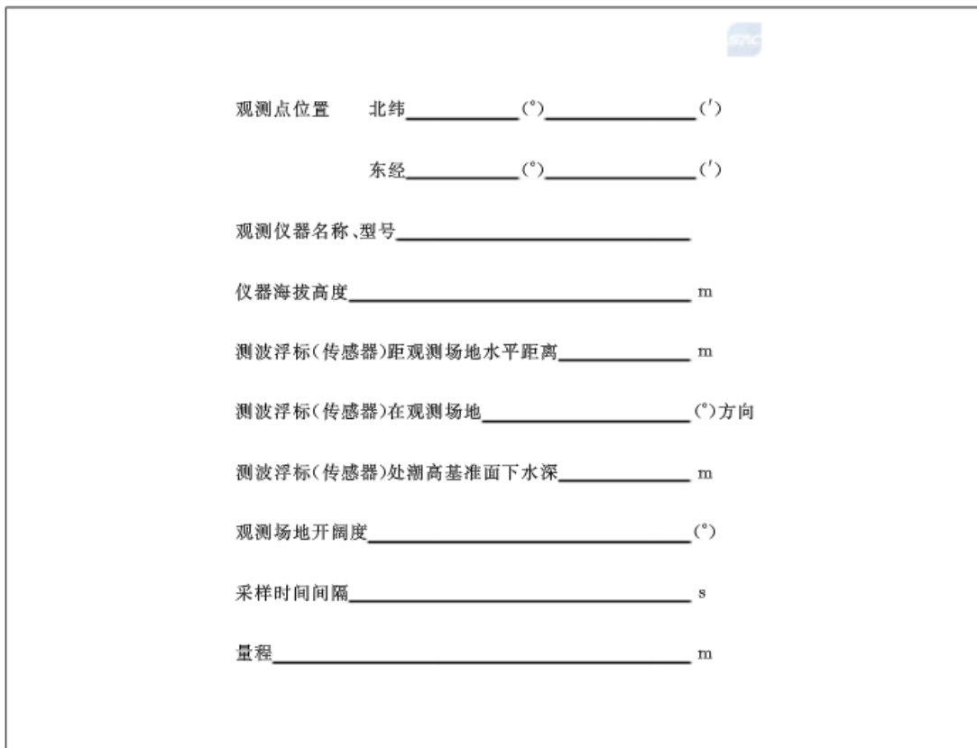
表 A.5 海浪观测记录簿封二格式

海浪观测记录簿封面格式见表 A.1;海浪观测记录簿封二格式见表 A.5;海浪观测记录表格式(1)见表 A.6;海浪观测记录表格式(2)见表 A.7。